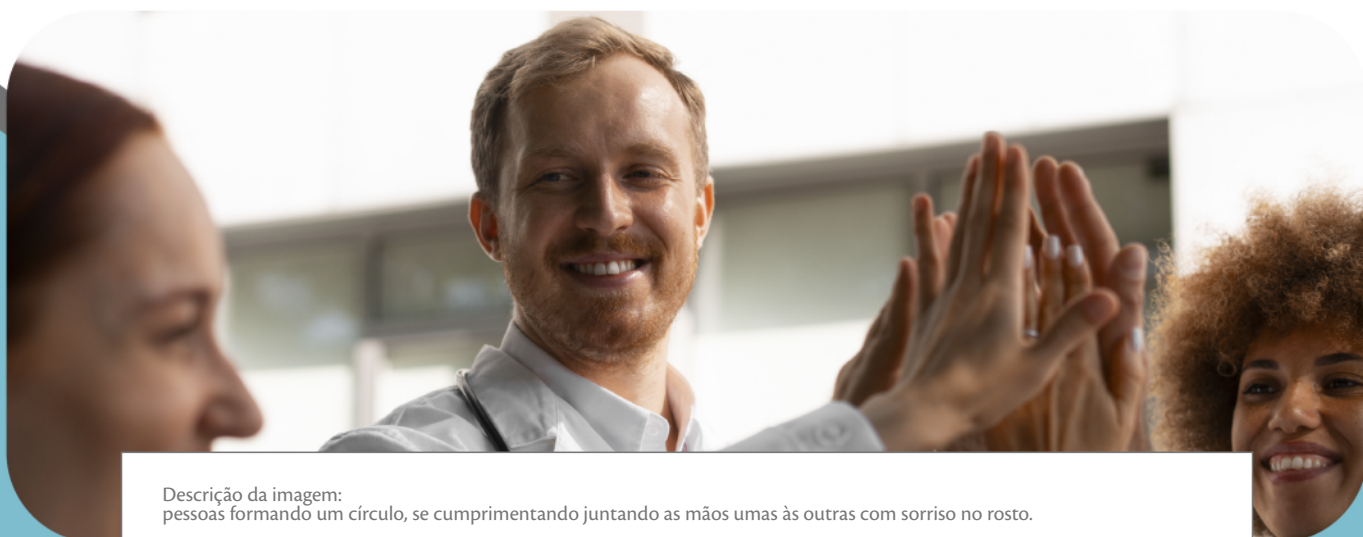
Descrição da imagem: pessoas formando um círculo, se cumprimentando juntando as mãos umas às outras com sorriso no rosto.

Equidade não é privilégio. É justiça na prática.