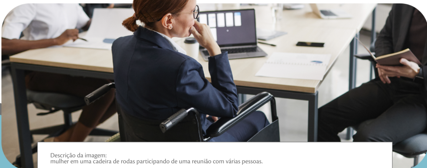
Descrição da imagem: mulher em uma cadeira de rodas participando de uma reunião com várias pessoas.

A inclusão começa na atitude de cada um de nós.